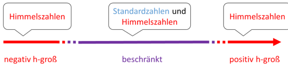
Abbildung 3: Die reelle Zahlengerade.