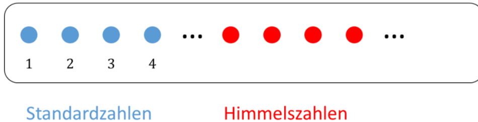
Abbildung 2: Die Menge \mathbb{N} der natürlichen Zahlen.

bereits bekannten Menge \mathbb{N} , die wir eigentlich bereits vollständig zu kennen glaubten. Das stellt sich nun als Irrtum heraus, denn was sind eigentlich die natürlichen Zahlen? Natürlich 1, 2, 3 und so weiter. Die Menge \mathbb{N} aller natürlichen Zahlen wird daher gerne einfach als \{1, 2, 3, \dots\} definiert, aber das ist keine richtige Definition, denn es ist überhaupt nicht klar, was im Laufe der Pünktchen alles noch kommen kann. Insbesondere sind hier keine Himmelszahlen ausgeschlossen.